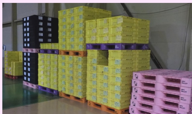
パレット色と内容物別に紐付管理