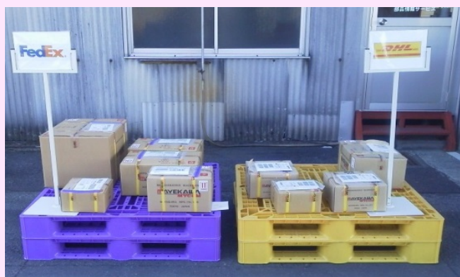
出荷先別に色別管理