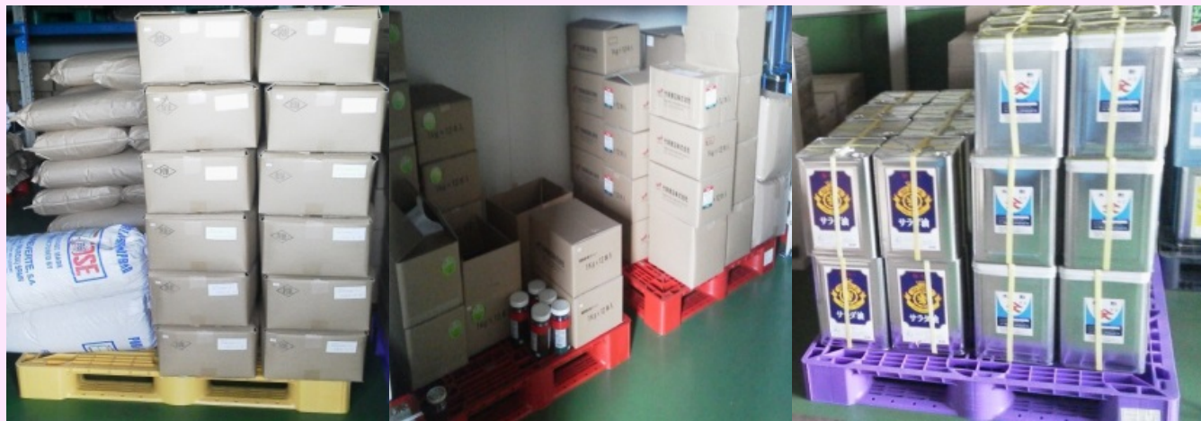
原材料、仕掛品、製品、各種資材等を色別管理